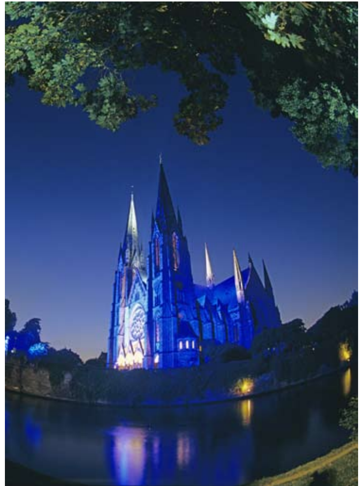
Église réformée Saint Paul - Strasbourg

CONTACT du G.I.S. "Sciences des religions et théologies à Strasbourg" : Francis Messner, directeur de l'UMR 7012 PRISME - Téléphone : 03 68 85 62 77 courriel : francis.messner@misha.cnrs.fr