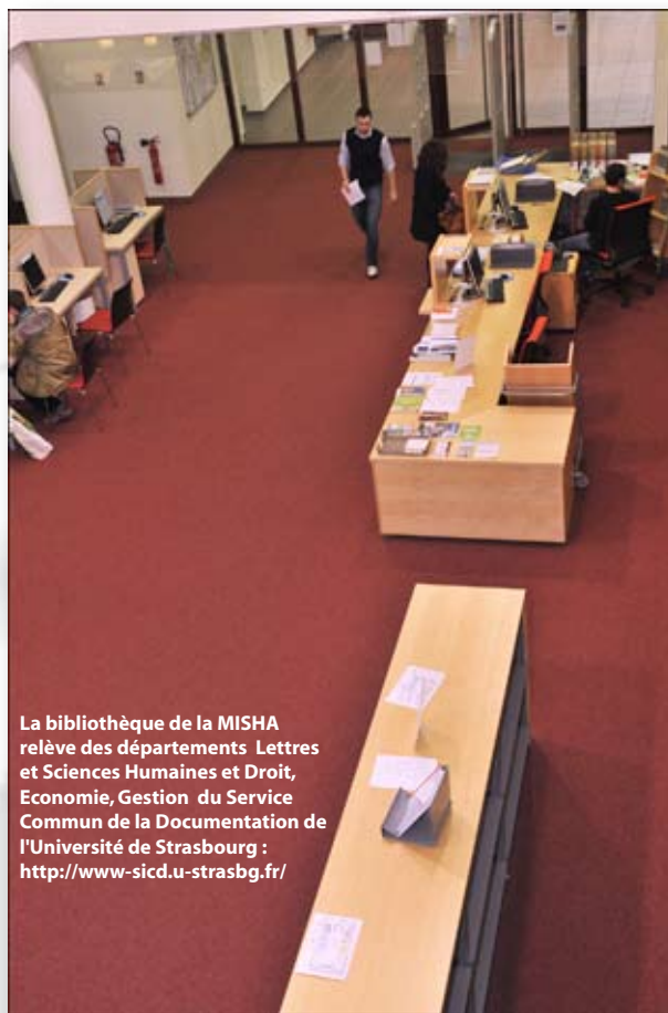
La bibliothèque de la MISHA relève des départements Lettres et Sciences Humaines et Droit, Economie, Gestion du Service Commun de la Documentation de l'Université de Strasbourg : http://www-sicd.u-strasbg.fr/

L'année 2008 en chiffres* : 53 000 entrées Une ouverture de la bibliothèque du lundi au vendredi de 9h à 19h (sauf périodes de vacances de Noël et mois d'août)