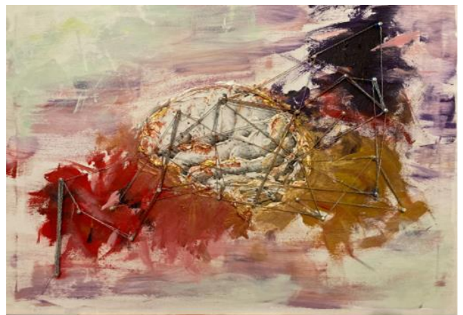
Eugénie SUTER - Untitled

Cette soirée de vernissage sera ponctuée par l'intervention de Daniel Cassel, Professeur de philosophie, la performance musicale de Vasilisa Zhukova, jeune scientifique harpiste.