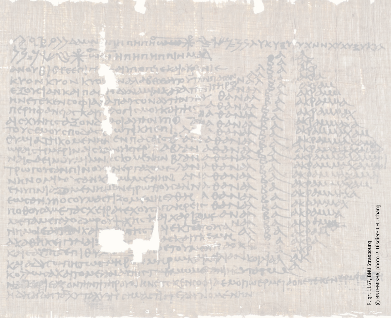
P. gr. 1167, BNU Strasbourg